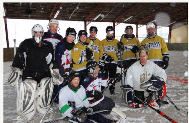
Hockey-Bottines : Les deux équipes finalistes