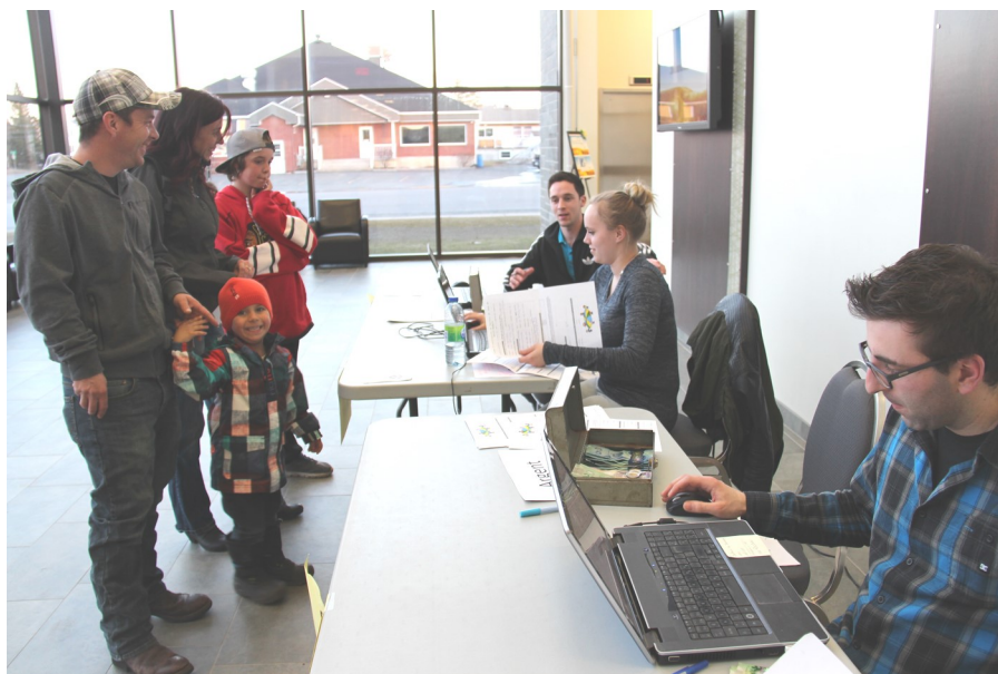
Une jeune famille procédant à l'inscription de leurs enfants pour le terrain de jeu

À la suite de notre planification stratégique et du dépôt de notre politique familiale, et face à l'augmentation grandissante de notre population, le conseil municipal a réagi en réorientant sa vision et ses projets.