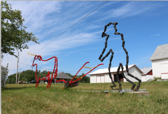
Paysage patrimonial : sculpture aratoire dans le Rang 3 Ouest.

Le danger qui guette les municipalités en croissance comme la nôtre est de tomber dans l'anonymat des rapports de voisinage, comme en ville.