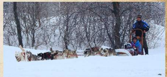
Randonnée en traîneau à chien du Festival du Flocon sur le terrain de soccer

Municipalité de Saint-Agapit 418-888-4620 | Gratuit