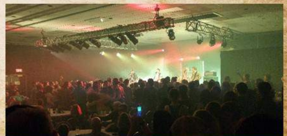
La foule lors du spectacle des Trois Accords