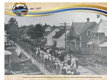
Monument commémoratif du 100 e anniversaire sur le terrain de la Fabrique de Saint-Agapit

Habituellement, l'événement était célébré au printemps (environ 60 jours après Pâques) et à l'automne, à la fête du Christ-Roi, qui marque la fin de l'année liturgique