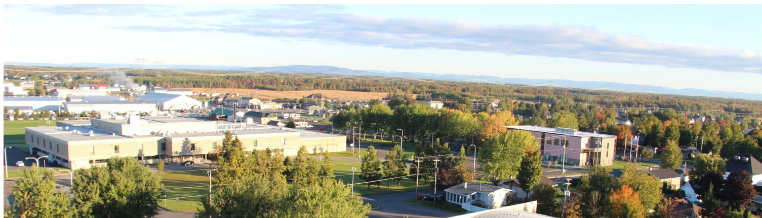
Vue du village de Saint-Agapit, du haut du clocher, en direction Nord-Est vers Québec