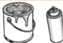
Peinture et teinture résidentielle, vernis, laque, aérosol, solvant