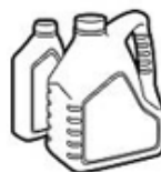
Contenants fermés d'huile à moteur et végétale